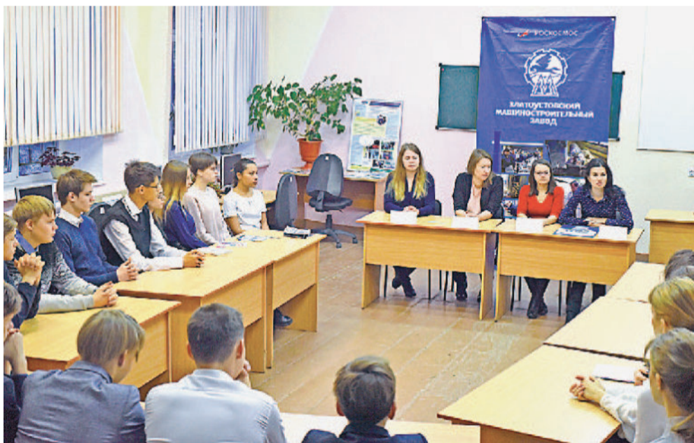
Специалисты АО «Златмаш» ответили на вопросы, интересующие школьников.

Праздник «День Златмаша», организованный педагогами школы № 8 в рамках профориентационного проекта «Мы — будущие машиностроители», позволил