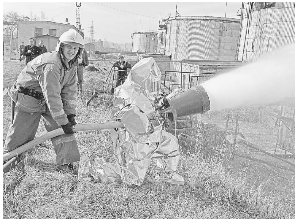
НА УЧЕНИЯХ. В расписании трудового коллектива отдела № 202 есть и теория, и практика.