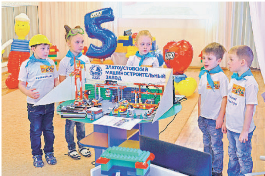
Я б в машиностроители пошёл. Пусть меня научат!

Маленькие конструкторы из детского сада № 72 получили специальные призы от АО «Златмаш» за творческий подход к знакомству с предприятием. Все командам вручили подарочные сертификаты на посещение объектов социального комплекса.