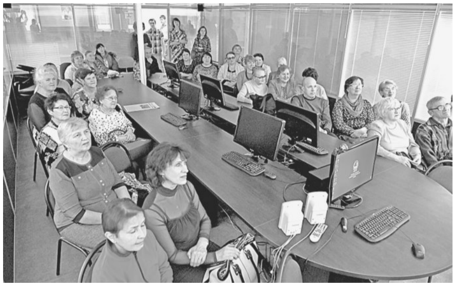
ВСПОМИНАЯ ВЕХИ ИСТОРИИ. Просмотр фильма стал ещё одним подарком к юбилею.

Масштабно, с размахом прошли праздничные мероприятия, посвящённые празднованию 50-летия со дня образования Центра информационных технологий — отдела № 288. Чествование ветеранов, демонстрация фильма об истории отдела, чаепития, экскурсии, торжественное собрание и юбилейный вечер во Дворце культуры «Победа» — всё было именно так, как мы задумали!