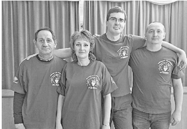
ИХ ОБЪЕДИНИЛ ЧГК!

Интеллектуальные бои состояли из нескольких