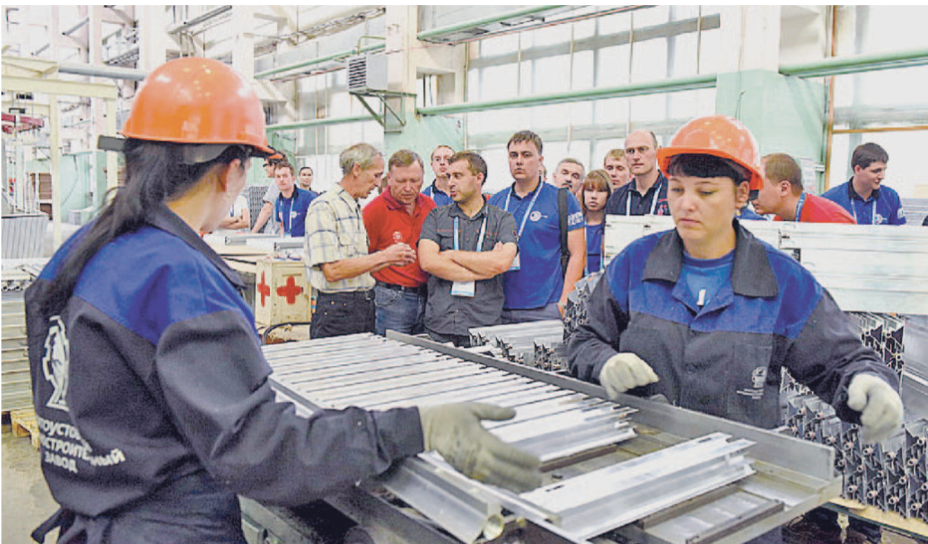
НА ЭКСКУРСИИ. Участники форума побывали на производствах радиаторов и алюминиевого профиля.