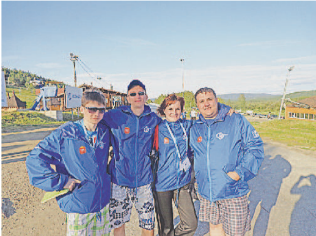
ЭТО МЫ! Делегация АО «Златмаш».

Впервые наше предприятие приняло участие в Международном молодёжном промышленном форуме «Инженеры будущего». В этом году масштабное мероприятие состоялось под Миассом, на территории комплекса «Солнечная долина».