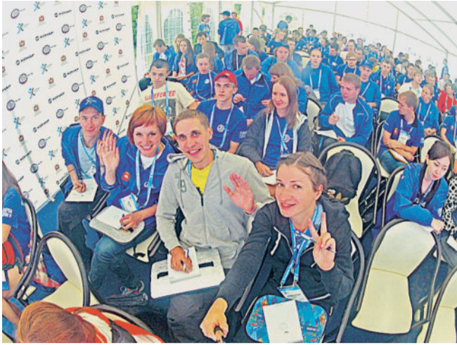
НАС МНОГО! Участники форума на тотальном диктante.