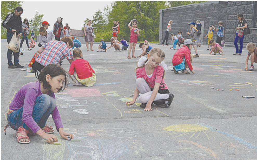
РИСУЕМ МИР. Один цветной мелок в руках детей сменялся другим.

В понедельник на площадке у Дворца Победы прошёл традиционный конкурс детских рисунков на асфальте.