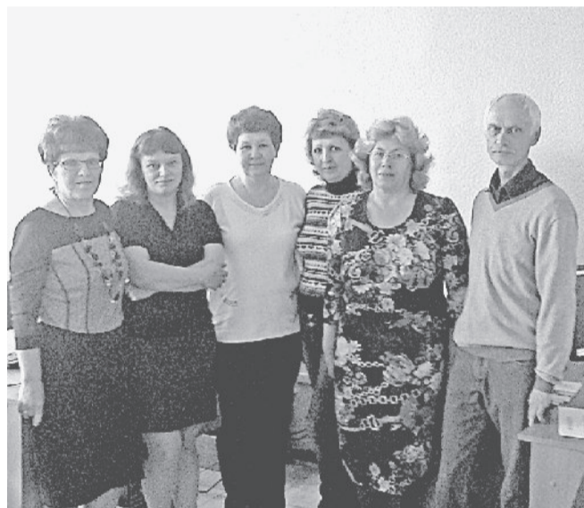
ПЕРЕД «ЭКЗАМЕНОМ».