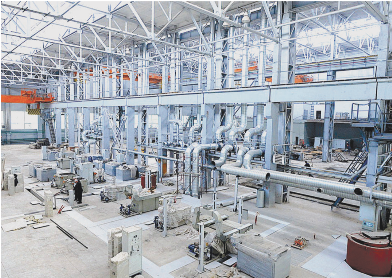
ПОЛНЫМ ХОДОМ. В этом корпусе разместится цех термической обработки.