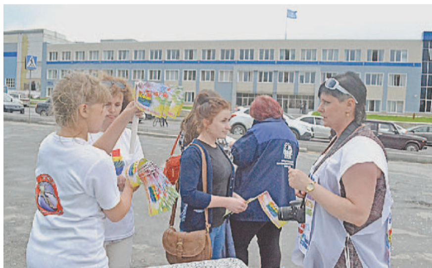
КАЖДОМУ – «ВАКЦИНА»!

Потому что у этой сладкой «вакцины» уникальный состав: частичка уважения, море любви, щепотка доверия, доля понимания, порция юмора, доза нежности и много-много терпения.