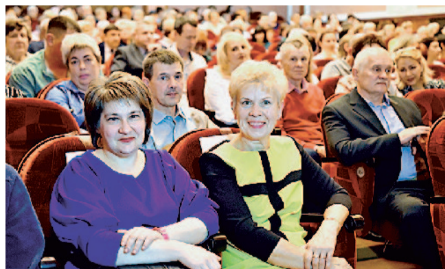
В предвкушении праздника