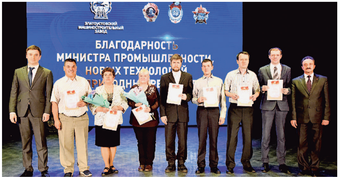
Многие работники АО «Златмаш» в День машиностроителя были отмечены правительственными наградами