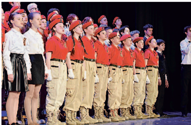
Юнармейцы школы № 2 на концерте АО «Златмаш» ко Дню Победы