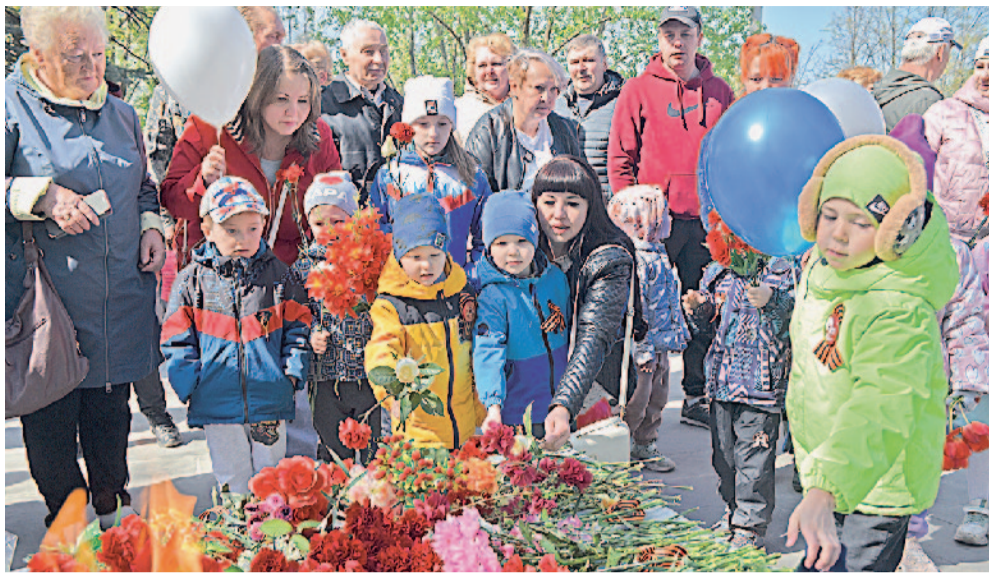
Дошкольники — постоянные участники мероприятий АО «Златмаш»

Традиционно средства распределяются среди учебных заведений исходя из того, насколько активно