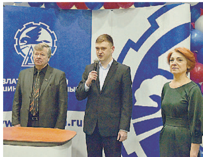
ПУСТЬ ПОБЕДИТ СИЛЬНЕЙШИЙ! Руководство приветствует участников конкурса.