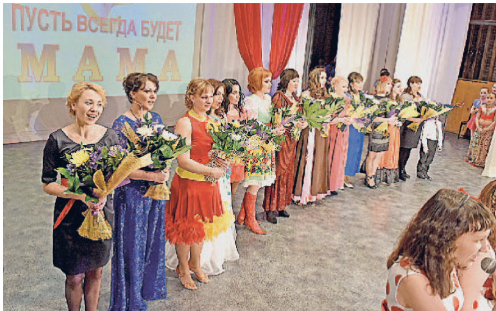
КРАСАВИЦЫ! 12 мам-заводчанок стали участницами оригинального совместного проекта.