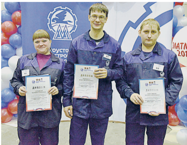
ОНИ ЛУЧШИЕ. В награду победитель и призёры получили дипломы и денежные премии.