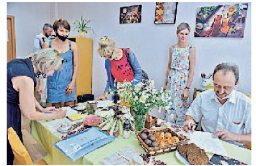
Работа профсоюзной комиссии на конкурсе «Лучшая комната для приема пищи».