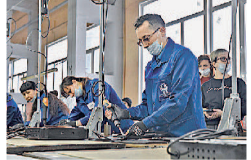
Конкурс «Лучший молодой слесарь механических работ ПТК ЭлБП и алюминиевых изделий».