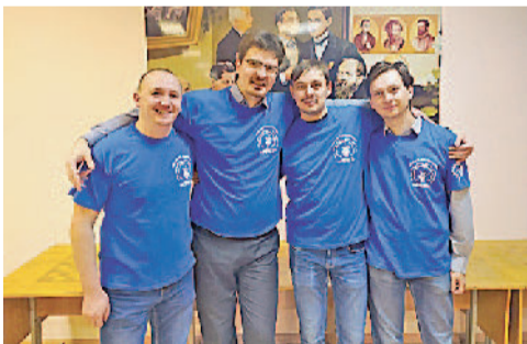
Заводская команда интеллектуалов «Союз».