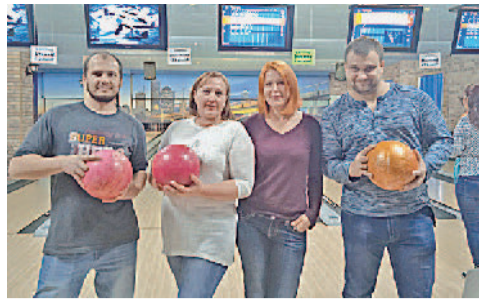
Участники заводского чемпионата по боулингу.