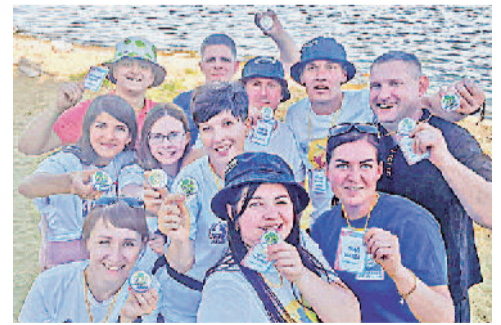
Участники XI Молодежного профсоюзного слета «УРА-2021».