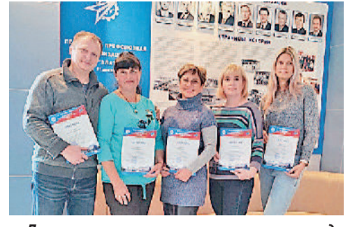
Лучшие уполномоченные по охране труда АО «Златмаш».