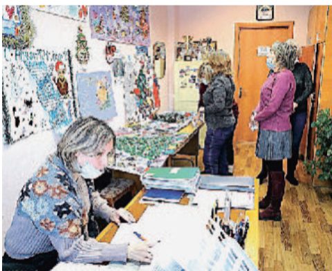
Подведение итогов конкурса новогодних стенгазет.