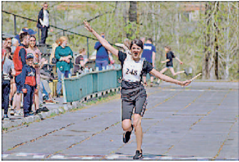
Покоряя очередной этап эстафеты на приз газеты «Трудовая честь Златмаш».