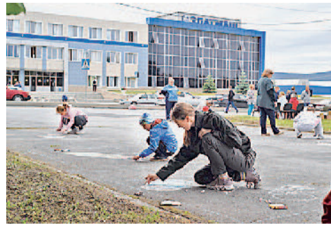
Конкурс детских рисунков на асфальте.