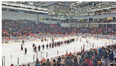
Хоккейный матч на ледовой арене «Трактор» в Челябинске.

Без поддержки профкома АО «Златмаш» не остались и любители померяться силами на интеллектуальном поприще. Заводская команда «Союз» провела в этом году крайне удачный игровой сезон. В октябре наши светлые умы завоевали «бронзу» на традиционном турнире по интеллектуальной игре «Что? Где? Когда?» среди промышленных предприятий области. А уже в октябре «Союз» одержал уверенную победу в финальном этапе Открытого чемпионата ГРЦ Макеева-2021.