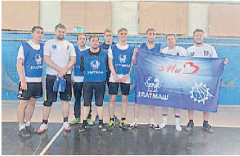
Заводская команда по мини-футболу.